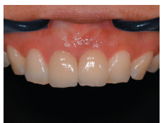
最終補綴(てつ)物装着時