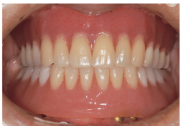
インプラントで支持された総義歯