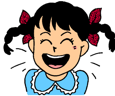
矯正でステキな笑顔に

しかし、永久歯が小さすぎるとき（矮小歯）や上唇の内側のひだが大きすぎる時には、開いたままになってしまいます。歯がこの様な状態になると、発音（特にサシスセソ）がしにくくなります。